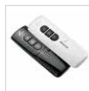
Bedienung für Außenrollladen Elektrisch Funk / Solar Funk per Funkhand-sender