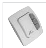
Bedienung für Außenrollladen Elektrisch per Schalter